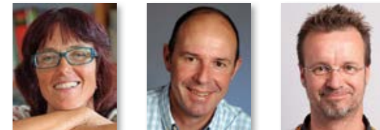
Fotos v. links n. rechts